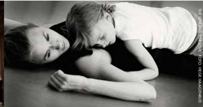
THE DEMAND FOR LOVE