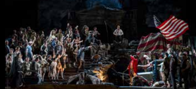
Illustrasjonsbilde fra Pagliacci