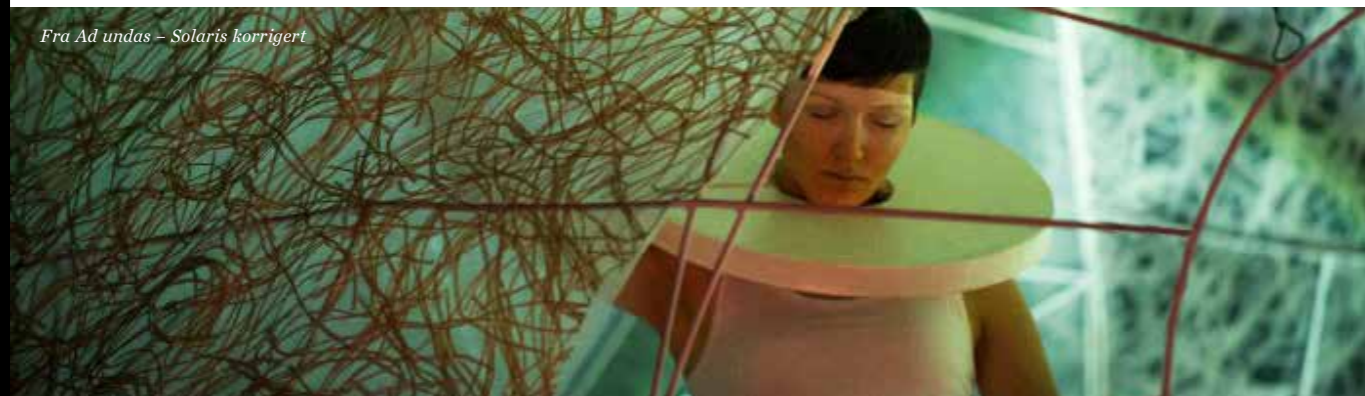
Fra Ad undas – Solaris korrigert