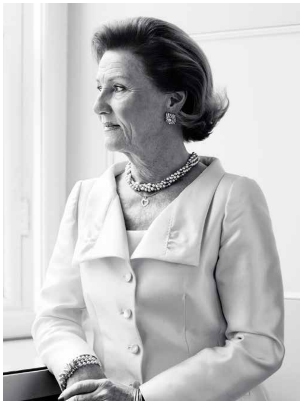
H.M. Dronning Sonja

Den Norske Opera & Balletts høye beskytter