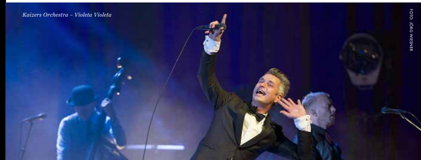
Kaizers Orchestra – Violeta Violeta

Den Norske Opera & Ballett ønsker å være et inviterende hus og bygge nye publikumsgrupper. Derfor åpner vi for andre forestillinger og konserter såfremt det er ledig tid på scenene. Dette utgjør også et økonomisk bidrag til virksomheten. I 2013 trakk blant annet Kaizers Orchestra seks fulle hus på Hovedscenen og Oslo Jazzfestival inviterte til åpningskonsert i Operaen.