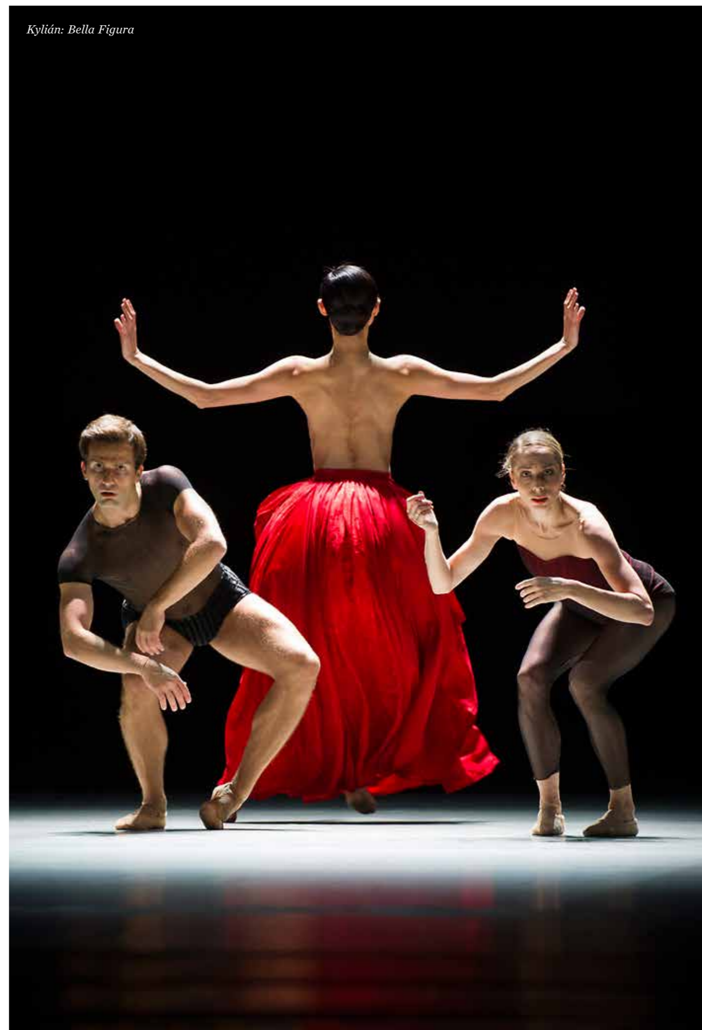
Kylián: Bella Figura