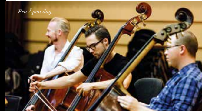
Fra Åpen dag.