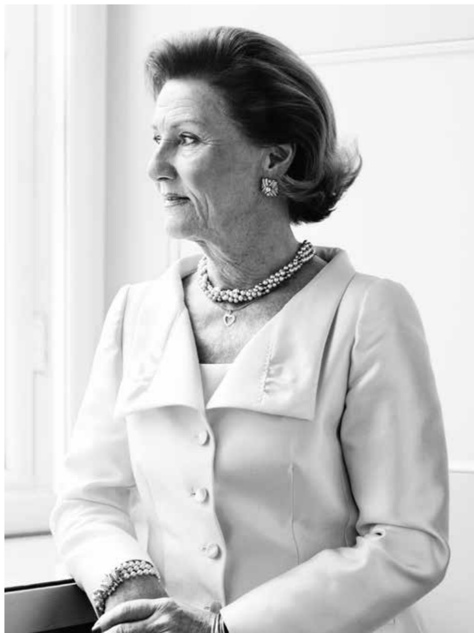
H.M. Dronning Sonja

Den Norske Opera & Balletts høye beskytter