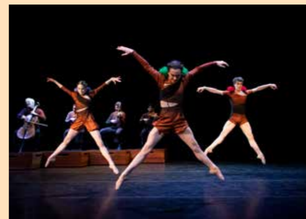
A Part Together