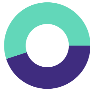
■ Andel kvinner DNO&B er 55%

DNO&B arbeider med mangfold langs flere akser, med mål å senke terskelen for deltagelse, gi flere muligheter, og øke representativiteten på flere plan. Den Norske Opera & Ballett har medarbeidere med et bredt spenn av bakgrunn og arbeidsoppgaver, herunder utøvende kunstnere, teknikere, fagarbeidere, håndverkere, akademikere og medarbeidere i ulike administrative funksjoner. Spennet i yrkesgrupper, kombinert med at ansatte kommer fra mange forskjellige nasjoner og kulturer, gir et rikt mangfold. Med egen ballettskole og eget barnekor, og ulike talentsatsinger, har virksomheten et stort aldersmessig mangfold.