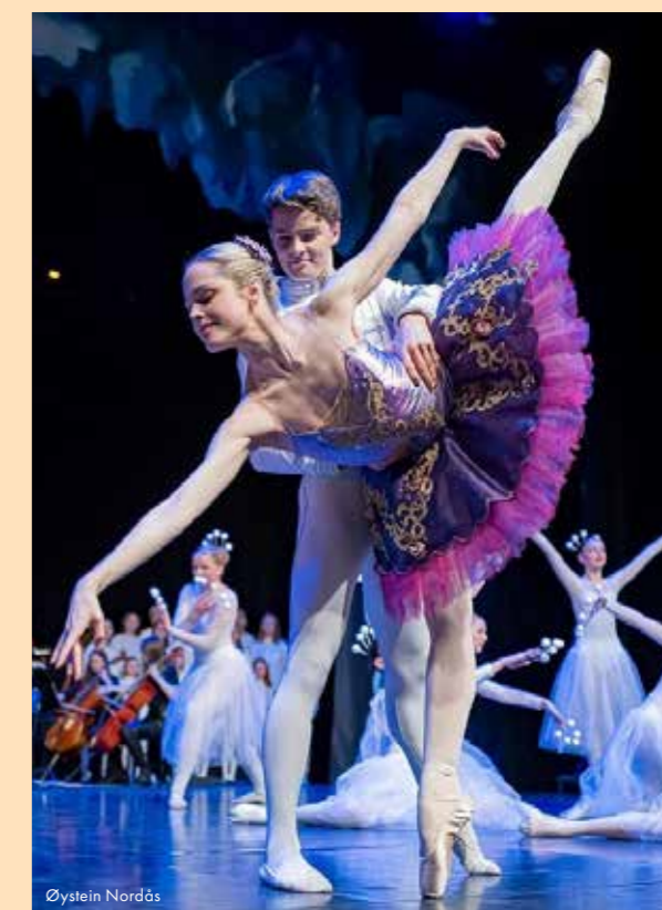
Nøtteknekkeren – Lillehammer