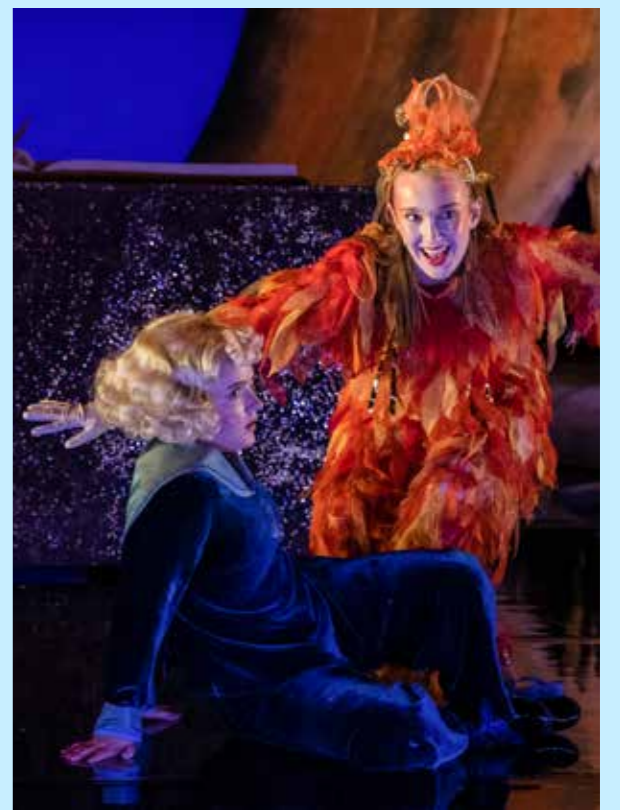
Barnet og trolldommen