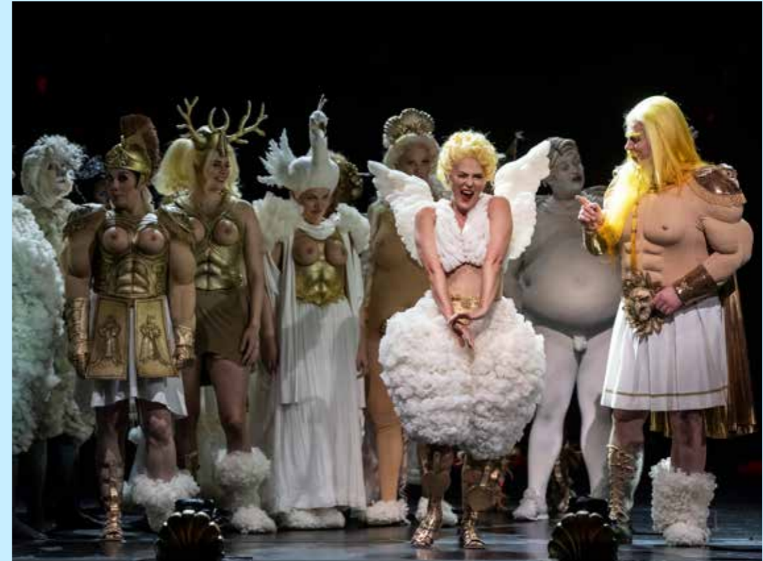
Orfeus i underverdenen