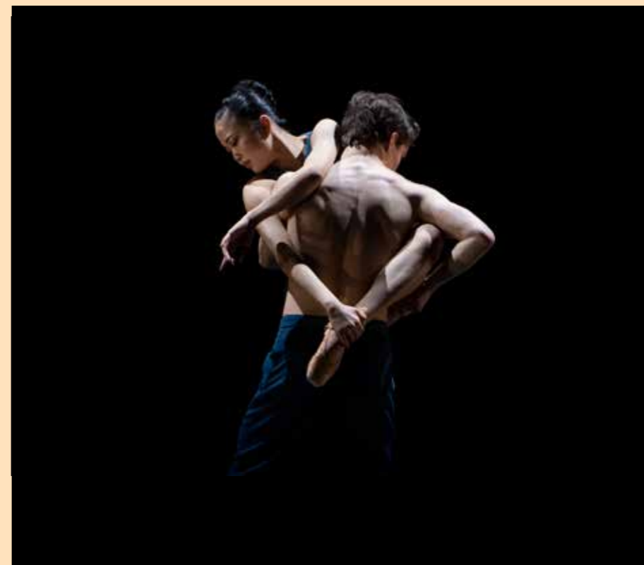
Fill in the Blank