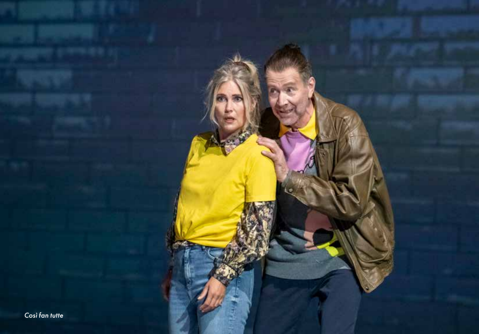
Cosi fan tutte