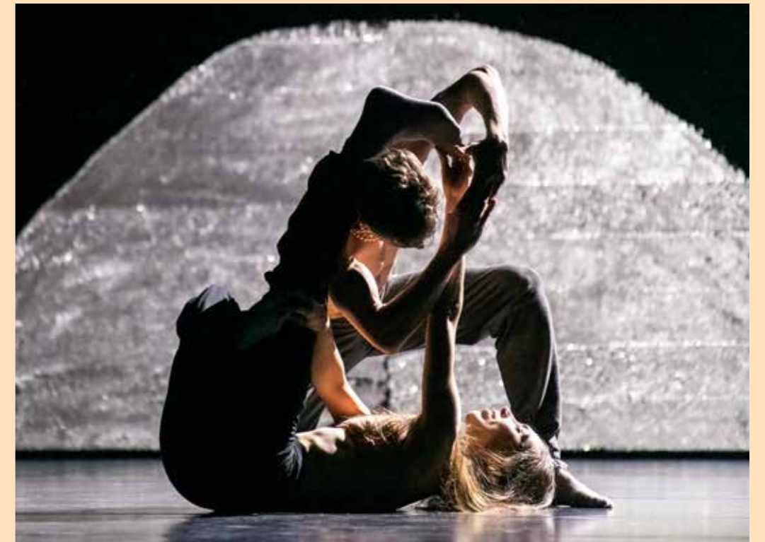
Some Girls Don't Turn

Dansere fra Nasjonalballetten Operaorkestret