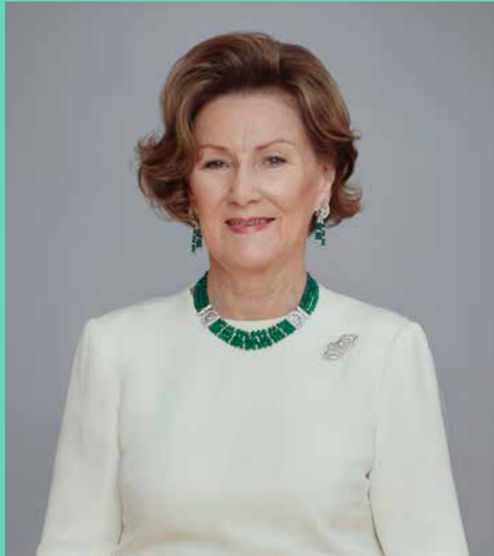
Hennes Majestet Dronning Sonja